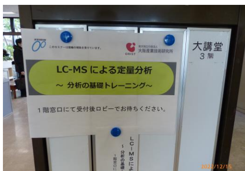
センター入口案内看板