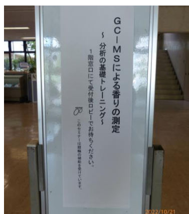
センター入口案内看板